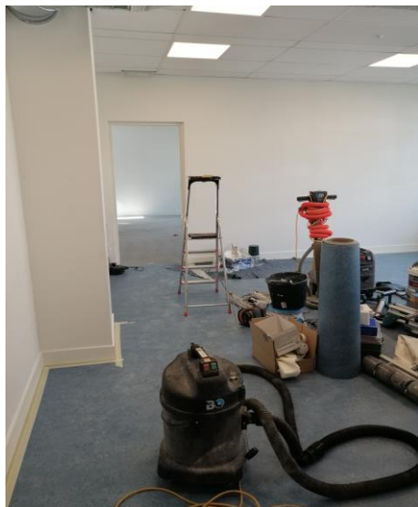
Twee leslokalen worden gestript