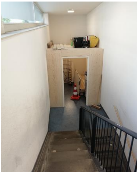
Nieuwe berging in de gang bij de gymzaal